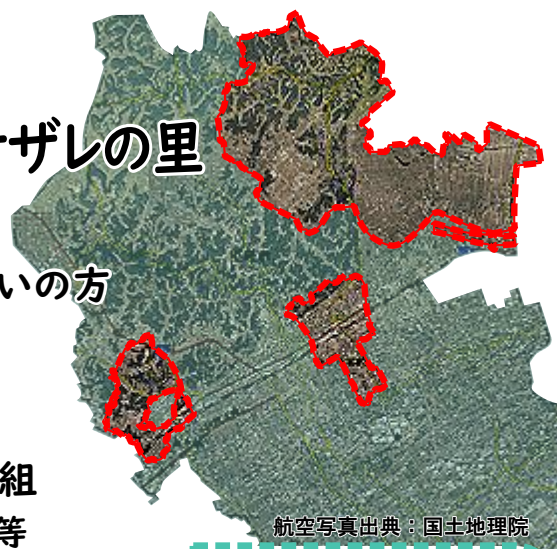
航空写真出典：国土地理院